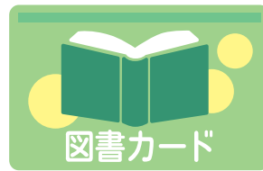
プリペイドカード (図書カードなど)