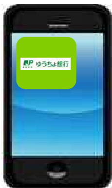
① アプリダウンロード