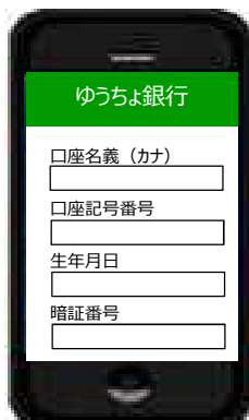
② ゆうちよ口座登録