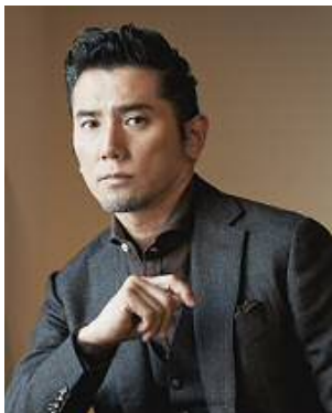
本木 雅弘（もとき まさひろ）さん