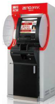
【現行の「ゼロバンク」】

OKB大垣共立銀行、ゆうちょ銀行およびファミリーマートはこれからも、地域のお客さまにご満足いただける便利なサービスをお届けしてまいります。