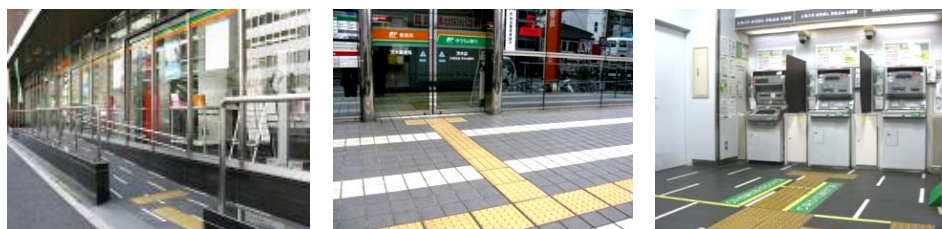
スロープや点字誘導ブロックの設置例

店舗出入口に段差を解消するためのスロープや補助用の手すりを設置しているほか、歩道などからATMコーナーや店舗に入る通路には点字誘導ブロックを敷設しています。